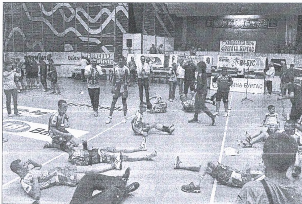
„Фрегата“ отново ще е домакин на силен турнир

ХК „Свиленград“ приема дамите в Свиленград на 9 и 10 февруари.